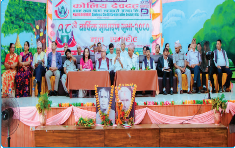
१८औं वार्षिक साधारण सभा मूल समारोह