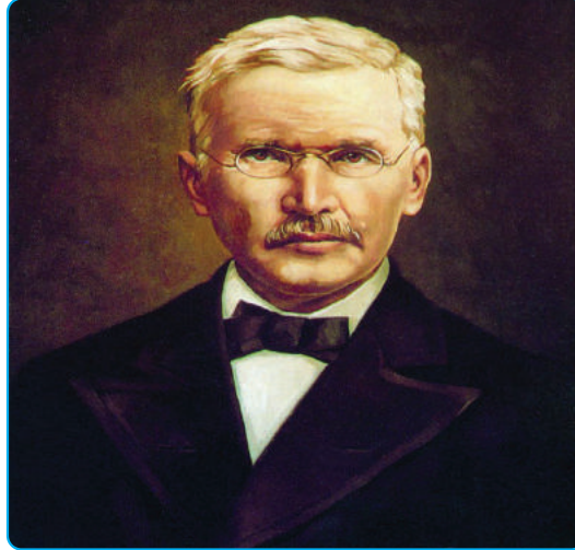
बचत तथा ऋण सहकारीका जन्मदाता एफ. डब्लु. राइफाईसन