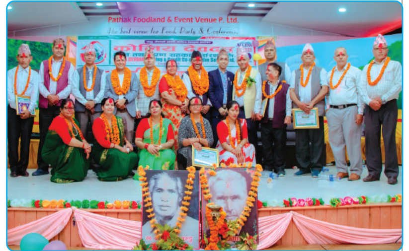
१८औं वार्षिक साधारण सभाबाट निर्वाचित संचालक समिति तथा लेखा सुपरीवेक्षण समिति

नव वर्ष २०८१ सालको पावन अवसरमा हाम्रा सम्पूर्ण शेयर सदस्य, बुद्धिजीवी, यस संस्थाका शुभेच्छुक तथा देश विदेशमा रहनु हुने समस्त नेपालीहरूमा सुख, शान्ति, उन्नति एवं उत्तरोत्तर प्रगतिको हार्दिक मंगलमय शुभकामना व्यक्त गर्दछौं ।