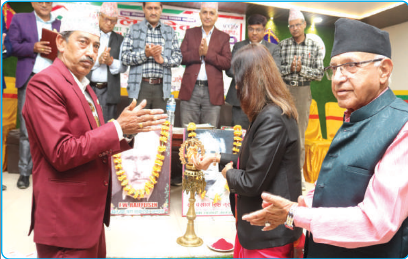
१९औं स्थापना दिवस कार्यक्रम