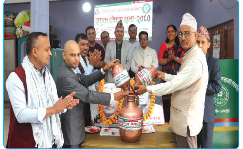
कोलिय देवदह साकोस र युवासंगम साकोस बिच एकीकरण घोषणा सभा